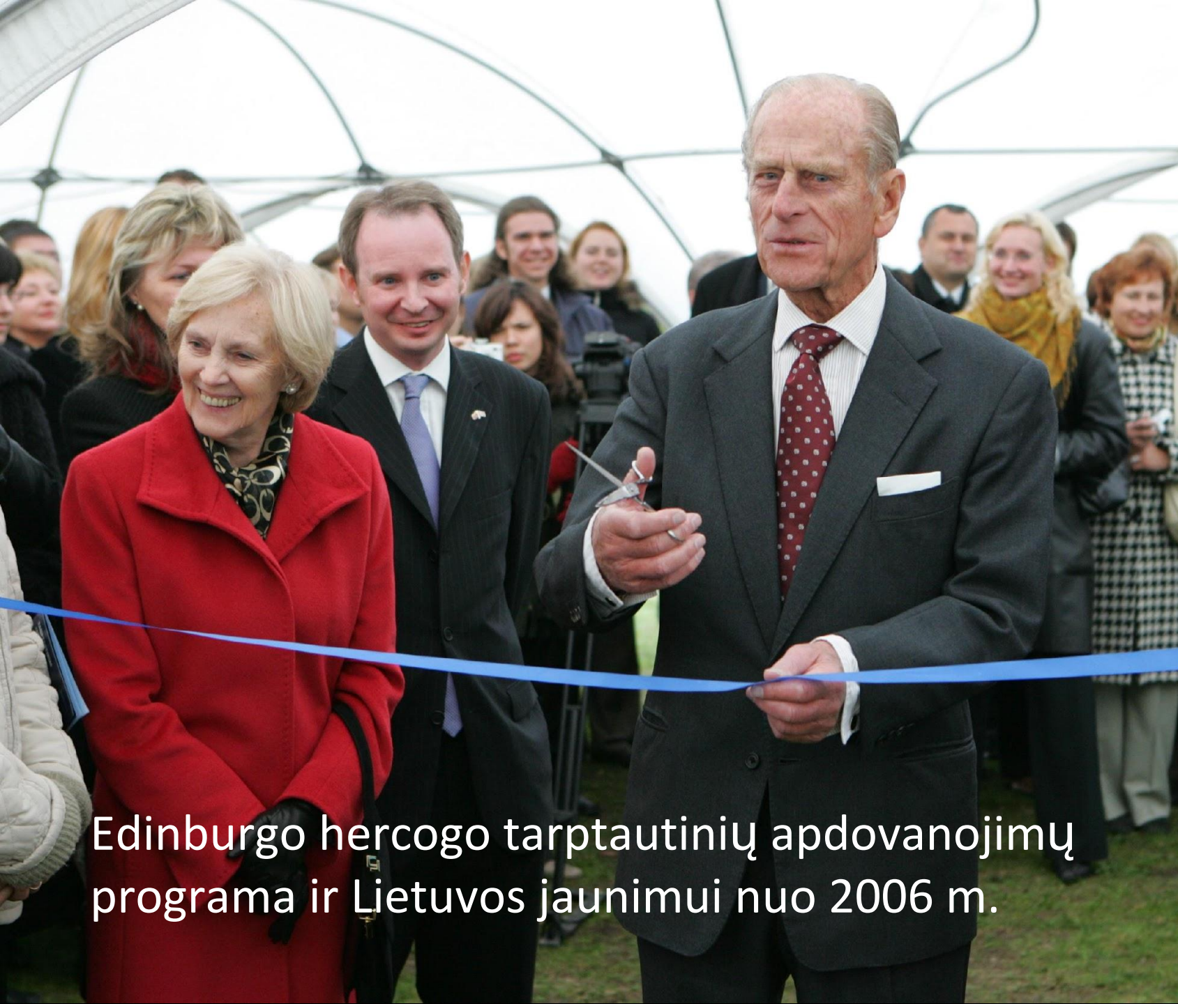
Edinburgo hercogo tarptautinių apdovanojimų programa ir Lietuvos jaunimui nuo 2006 m.