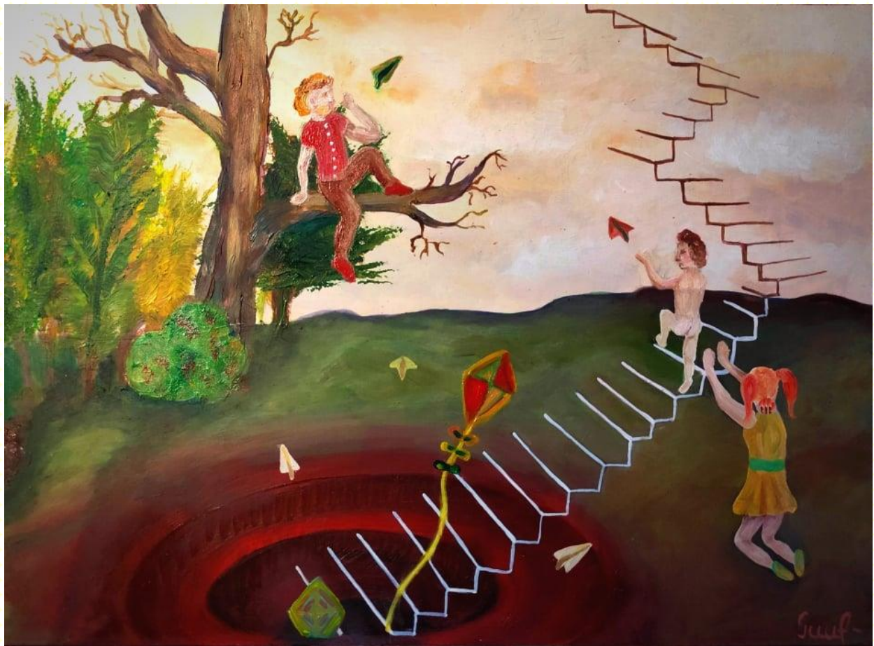
Gretos Dumbliauskaitės piešinys